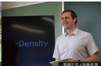
英語で学ぶ体験授業