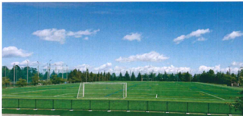
※人工芝周囲のフェンスに広告を掲載します

広告掲載場所 東奥義塾高等学校サッカー・ラグビー場のフェンス 住所 青森県弘前市石川字長者森61-1