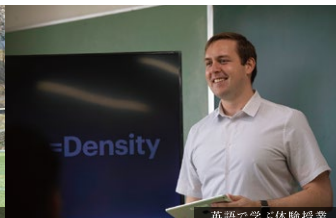
英語で学ぶ体験授業